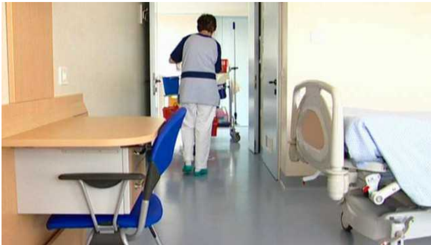
Bologna, 22 dipendenti di una ditta di pulizia rinunciano alle ferie

San Giovanni in Persiceto (Bologna), 8 luglio 2019 – Ognuna di loro ha rinunciato a qualche giorno di ferie per aiutare la collega malata . E pazienza se il lavoro è duro, la paga oraria di poco superiore ai 7 euro lordi e gli stipendi medi sui 600 euro o poco più.